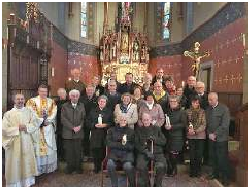
Jubelpaarmesse, am 18.11.2017