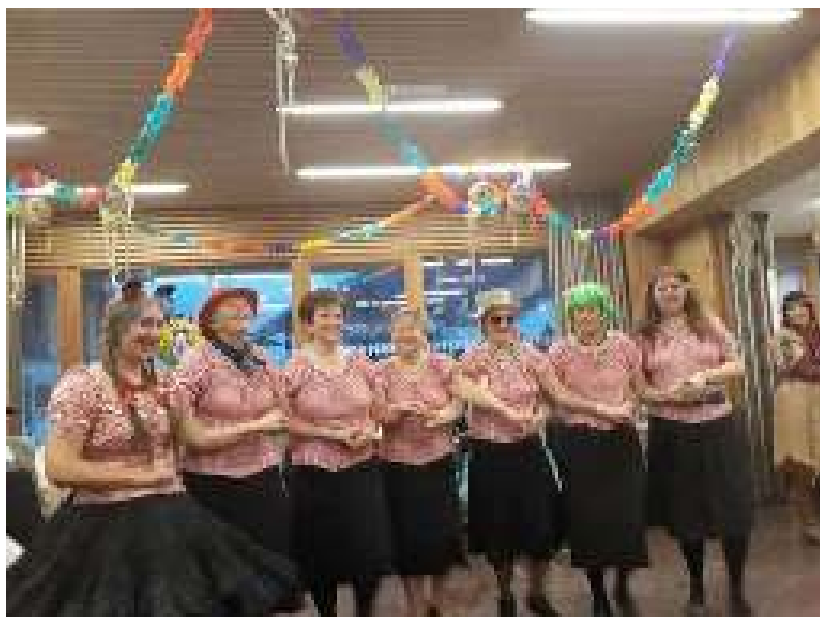
Pfarrfasching, am 11.2.2018